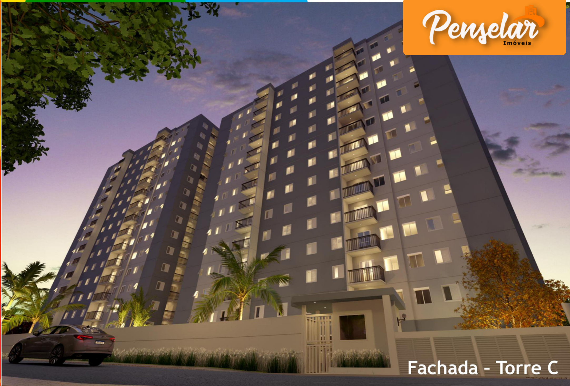
Fachada - Torre C