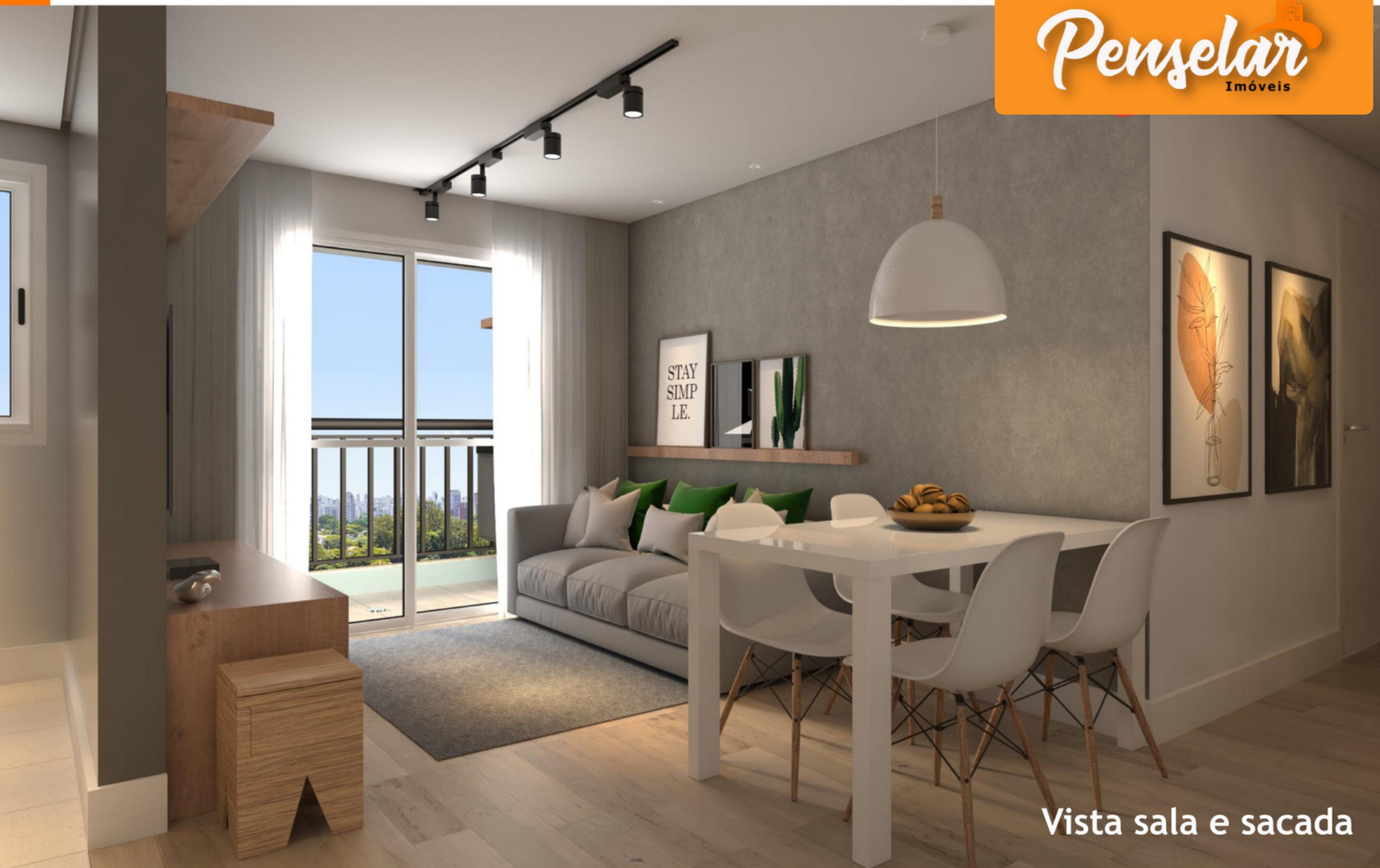
Vista sala e sacada