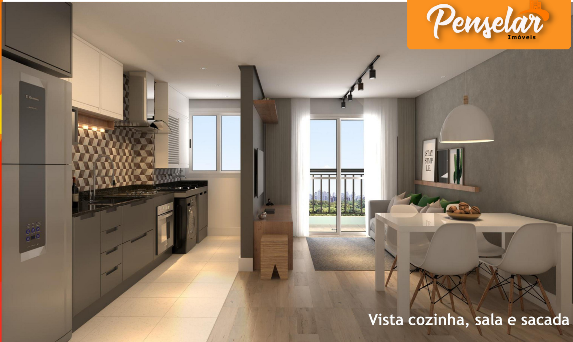
Vista cozinha, sala e sacada